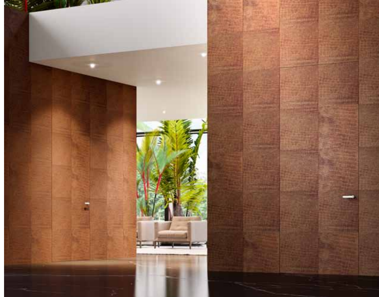
ALBA | FILO 10 MENTEŞELİ KAPI | Deri ve Mermer Finisaj | Duvarla bütünlük oluşturan duvar doğrama sistemi

Çalışmamızın arkasında, gizli bir deneyim ve ayrıcalıklı tasarımdan oluşan İtalyan tarihi yatar. Kesin teknik bilgi, maksimum düzeyde “özelleştirme” ile birlikte, en talepkar estetik istekleri ve fonksiyonel beklentileri karşılamaya imkan veren, duvarla bütün kapının gözle görülür basitliği ile maskelenmektedir.