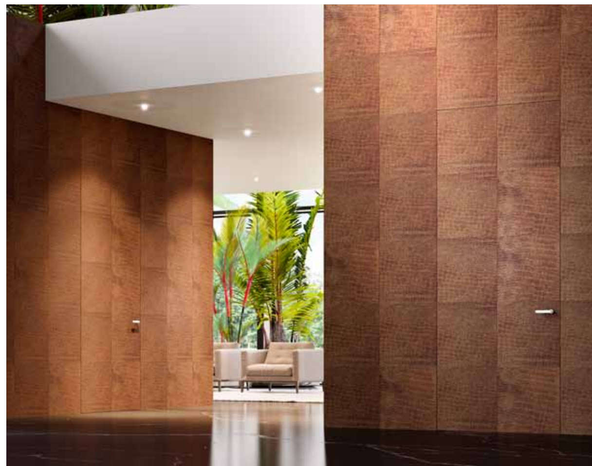
ALBA | РАСПАШНАЯ ДВЕРЬ FILO 10 | Двухстворчатая | Система панелей, обеспечивающая непрерывность со стеной

За нашей работой пролегает целая история развития итальянского дизайна и колоссальный производственный опыт. Высокий уровень технологических ноу-хау, скрывающихся под кажущейся простотой двери в сочетании с персонализацией проектов под клиента, позволяют удовлетворить даже самые взыскательные требования к эстетическим и функциональным характеристикам.