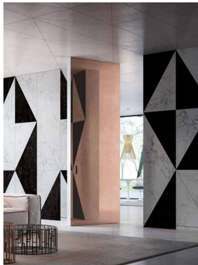
BREZZA | Поворотная дверь с вертикальной осью | Версия FILO 10 Отделка металл | заглубленная РУЧКА В ВИДЕ ПЕРЕВЕРНУТОЙ «Т»

Мы создали широкую и организованную сеть высококвалифицированных специалистов по монтажу дверей по всему миру, обладающих высокими компетенциями и профессионализмом, гарантирующих функциональность и долговечность продукции.