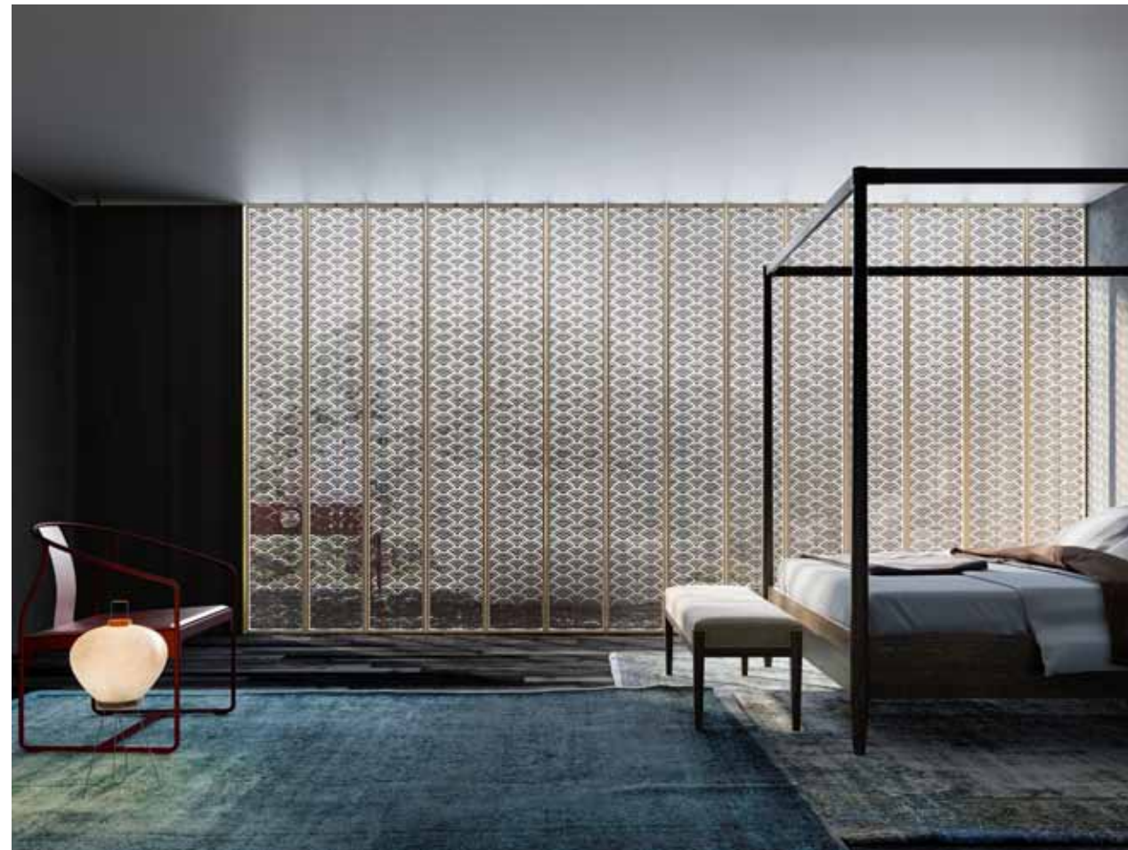
BREZZA | SYSTÈME ZEFIRO VERSION AVEC CADRE | Pivot central Finition cadre en aluminium anodisé bronze clair | Finition panneau, verre imprimé

Derrière notre travail se trouve toute une histoire italienne cachée racontant l'expérience et le design exclusif. Le savoir-faire technique précis est masqué par l'apparente simplicité de la porte à fleur de mur fini qui, combinée avec un niveau maximal de « personnalisation », afin de satisfaire les plus hauts niveaux de désirs esthétiques et d'attentes fonctionnelles.