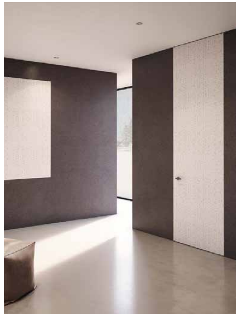
TECHNISCHE VERSCHLÜSSE | EXTRA CLOSURES | Furnierte Oberfläche | unsichtbarer Griff

Unser umfangreiches und gut organisiertes Netzwerk aus Monteuren ist weltweit verfügbar; ihre Erfahrung und Professionalität stehen zu Ihrer Verfügung, um sicherzustellen, dass Sie das Design, die Zweckmäßigkeit sowie die Langlebigkeit unserer Produkte ansprechen.