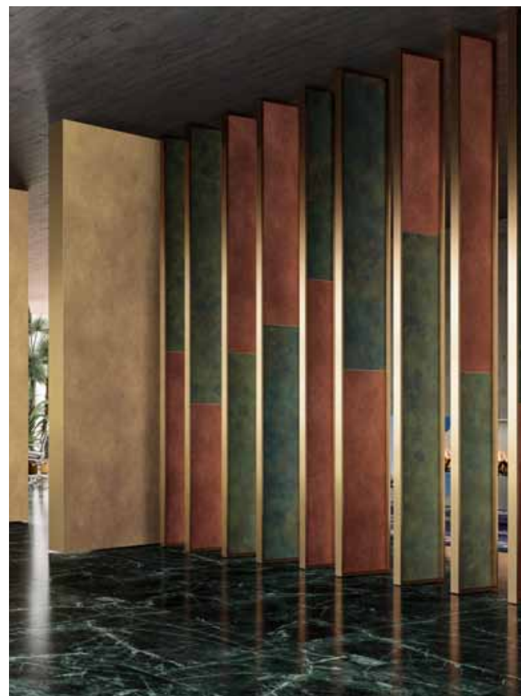
BREZZA | SISTEMA ZEFIRO | Versão com cornija Cornija anodizada em bronze claro | Acabamento das folhas: metal e couro

Nossa ampla e bem organizada rede de equipes especializadas de instaladores está disponível em todos os países. Sua experiência e profissionalismo estão à disposição para garantir que nossos produtos sejam e-téticos e agradáveis, funcionais e altamente duráveis.