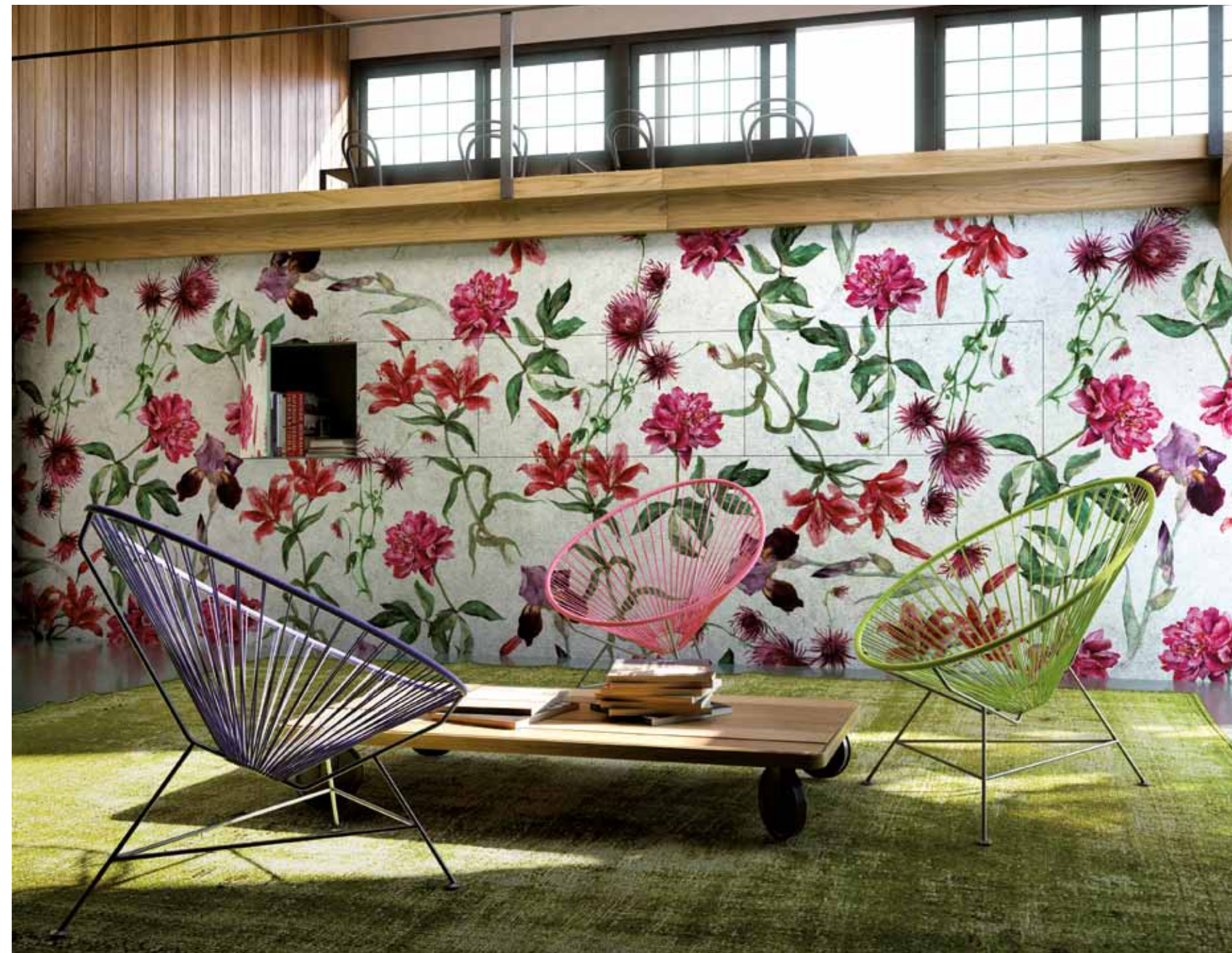
CHIUSURE TECNICHE | Nicchio multiante affiancate | serratura premi aprì | rivestimento con carta da parati

Grazie all'alta qualità e ai risultati ottenuti, LINVISIBILE offre una garanzia esclusiva di 10 anni sui telai in alluminio e una garanzia di 2 anni sui pannelli.