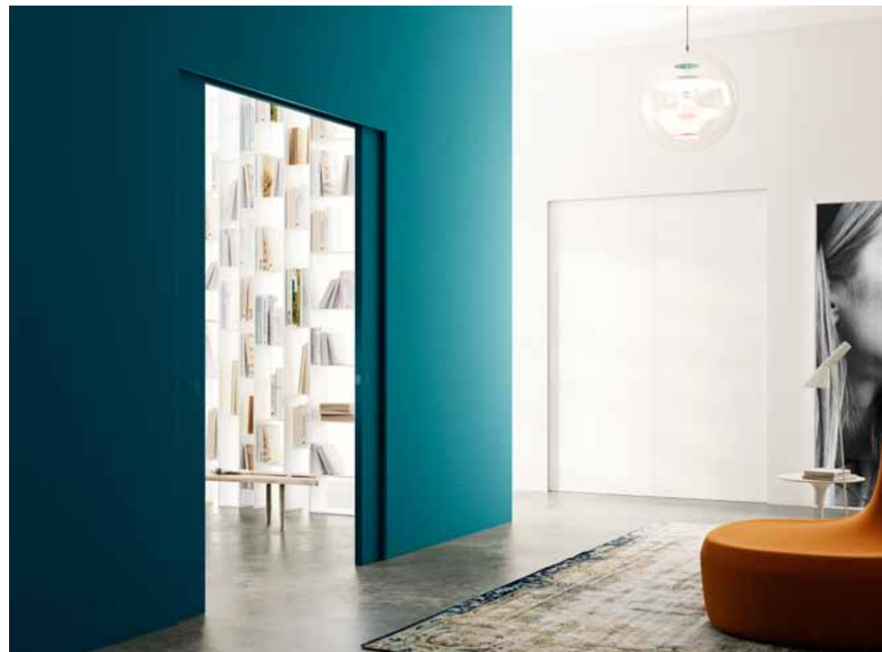
MAREA | SCORREVOLE CENTRO PARETE | versione a doppia anta | rivestimento con carta da parati

Dietro al nostro lavoro si nasconde una storia tutta italiana fatta di design e grande esperienza. L'elevato know how mascherato dall'apparente semplicità della porta filo muro, insieme all'altissimo grado di "customizzazione" dei progetti, permette di soddisfare anche i più esigenti desideri estetici e funzionali.