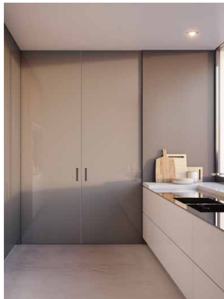
MAREA | PORTA CORREDIÇA CENTRO PAREDE Versão com folha dupla | Acabamento laqueado fosco | Maçaneta de encaixe

Nossa ampla e bem organizada rede de equipes especializadas de instaladores está disponível em todos os países. Sua experiência e profissionalismo estão à disposição para garantir que nossos produtos sejam e-téticos e agradáveis, funcionais e altamente duráveis.