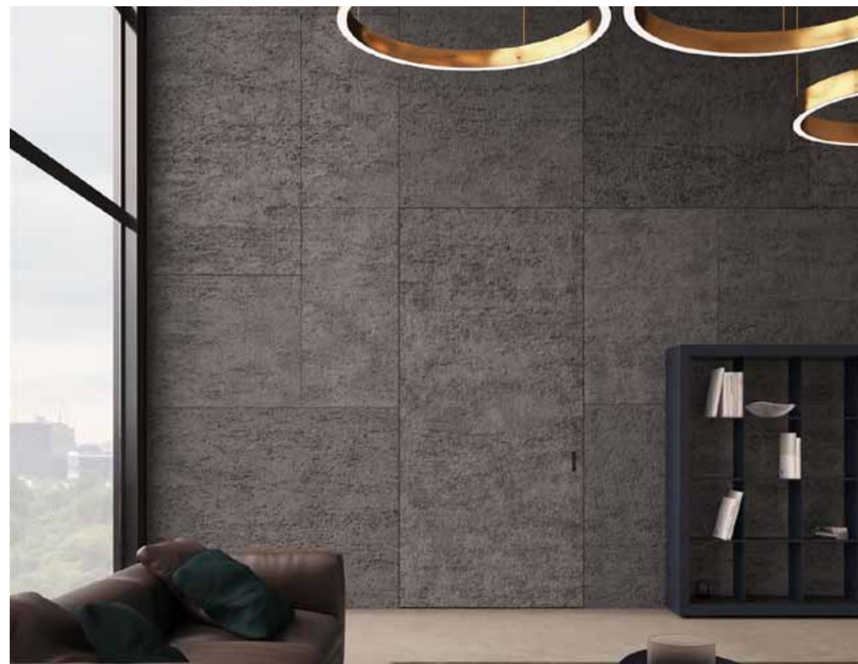
MAREA | PORTA CORREDIÇA ESCAMOTEÁVEL | Versão manual | Acabamento em pedra natural Sistema boiserie em continuidade com a parede-painel

Por trás do nosso trabalho, há uma história italiana oculta de experiência em design exclusivo. O know-how técnico preciso é mascarado pela simplicidade aparente da porta nivelada na parede que, combinado com o nível máximo de "personalização", permite satisfazer os desejos estéticos e expectativas mais funcionais mais exigentes.