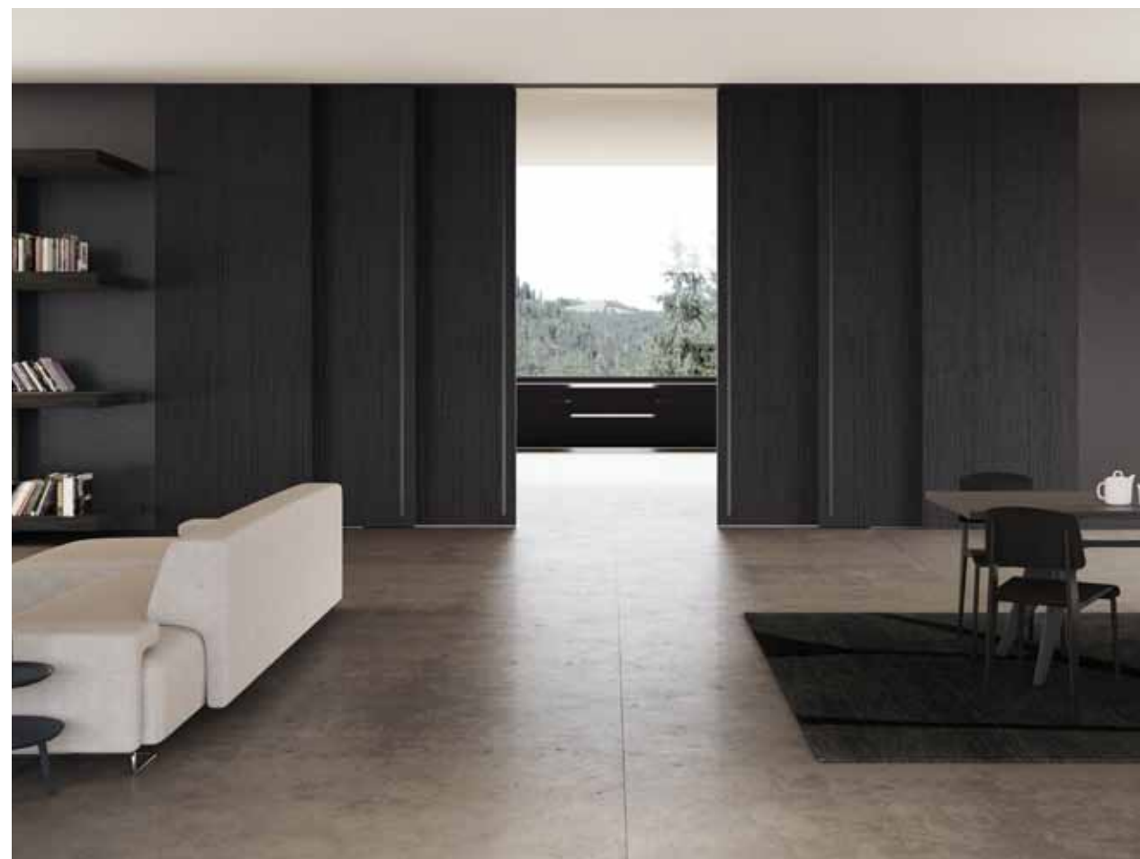
MAREA | РАЗДВИЖНАЯ СИСТЕМА В ПРОЕМЕ ALTORIANO BY GIULIO CARPELLINI | Множественные створки Отделка: дуб тонированный черный | заглабленная ручка на всю высоту полотна, анодированная, серебристого цвета

За нашей работой пролегает целая история развития итальянского дизайна и колоссальный производственный опыт. Высокий уровень технологических ноу-хау, скрывающихся под кажущейся простотой двери в сочетании с персонализацией проектов под клиента, позволяют удовлетворить даже самые взыскательные требования к эстетическим и функциональным характеристикам.