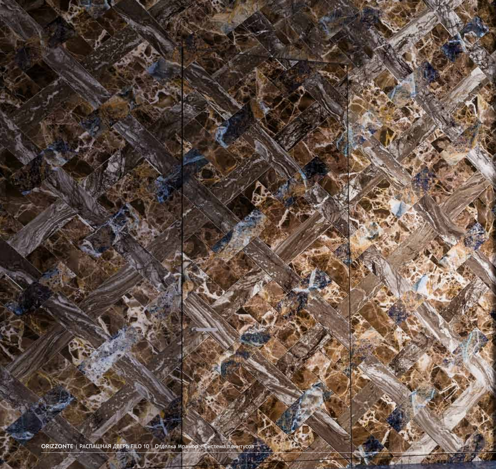
ORIZZONTE | РАСПАШНАЯ ДВЕРЬ FILO 10 | Отделка Мрамор | Система плинтусов