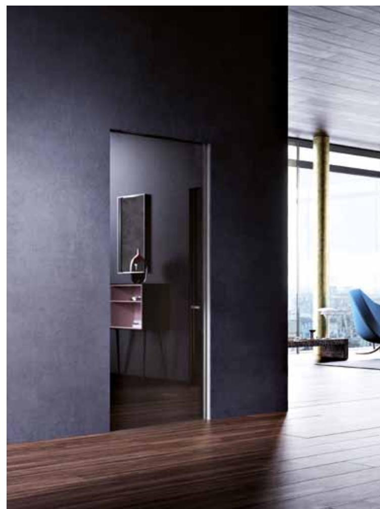
MAREA | РАЗДВИЖНЫЕ ДВЕРИ ВДОЛЬ СТЕНЫ Исполнение со стеклянной створкой | отделка из темного стекла

Мы создали широкую и организованную сеть высококвалифицированных специалистов по монтажу дверей по всему миру, обладающих высокими компетенциями и профессионализмом, гарантирующих функциональность и долговечность продукции.