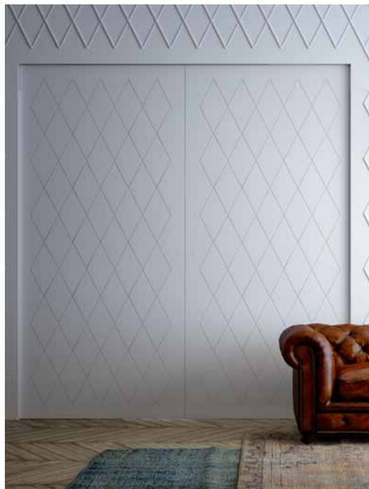
MAREA | Corrediças Centro Parede | versão com folha dupla Superfície pantografada | Acabamento laqueado fosco | Maçaneta invisível

Nossa ampla e bem organizada rede de equipes especializadas de instaladores está disponível em todos os países. Sua experiência e profissionalismo estão à disposição para garantir que nossos produtos sejam e-téticos e agradáveis, funcionais e altamente duráveis.