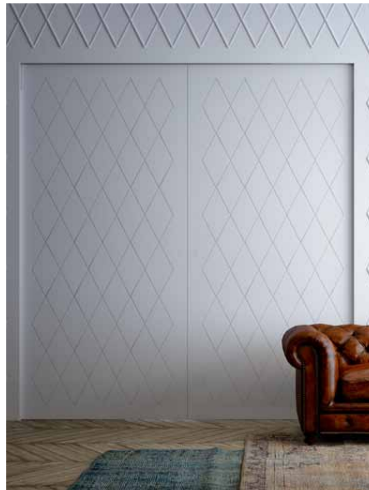
MAREA | IN DER WAND SCHIEBETÜR | 2 Flg. | Oberfläche mit Kassettenbearbeitung | Matte lackierte Oberfläche | Unsichtbarer Muschelgriff

Unser umfangreiches und gut organisiertes Netzwerk aus Monteuren ist weltweit verfügbar; ihre Erfahrung und Professionalität stehen zu Ihrer Verfügung, um sicherzustellen, dass Sie das Design, die Zweckmäßigkeit sowie die Langlebigkeit unserer Produkte ansprechen.