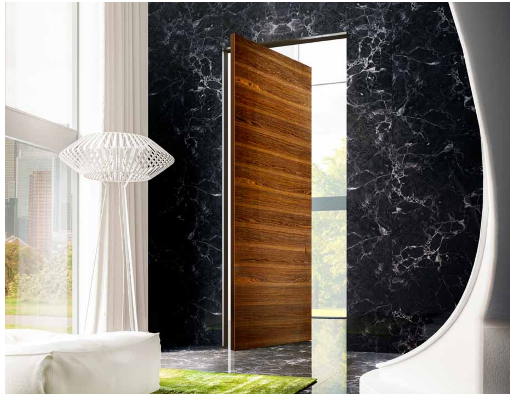
BREZZA | DREHFLÜGELTÜR | Oberfläche Teak furniert | eingefrägter Griff

Für unsere Produkte, 100% Made in Italy , bieten wir zusätzlich zu unserem Versprechen, qualitativ hochwertige und außergewöhnliche Ergebnisse zu erzielen, eine exklusive 10-Jahres-Garantie auf unsere Aluminiumrahmen und eine 2-Jahres-Garantie auf unsere Türblätter.