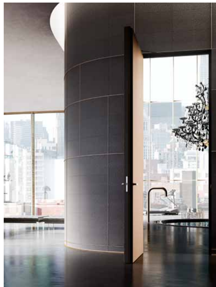
ORIZZONTE | Revestimento preto em pele de tubarão Sistemas boiserie e Rodapé em continuidade com a parede

Nossa ampla e bem organizada rede de equipes especializadas de instaladores está disponível em todos os países. Sua experiência e profissionalismo estão à disposição para garantir que nossos produtos sejam e-téticos e agradáveis, funcionais e altamente duráveis.