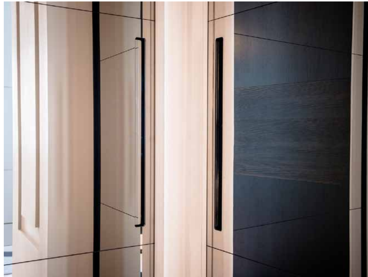
MAREA | SCHIEBETÜR | eingefräster Muschelgriff | Glas MiraStar® (Saint-Gobain)

Hinter unserer Arbeit steckt eine verborgene italienische Geschichte von Erfahrung und exklusivem Design. Das hervorragende technische Know-How bleibt unter der scheinbaren Einfachheit einer wandbündigen Tür verborgen, die durch maximale Anpassung an Kundenwünsche stets den höchsten Ansprüchen an Design und Funktionalität gerecht wird.