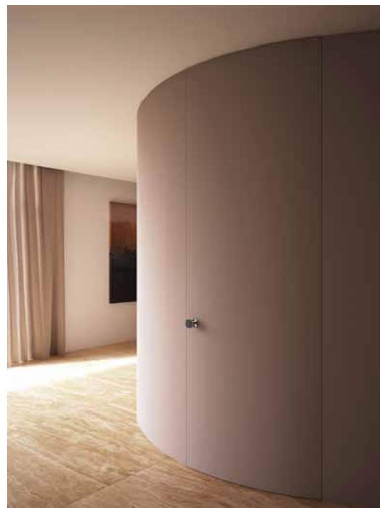
ALBA | PORTA BATENTE CURVA | Acabamento pintado como a parede

Nossa ampla e bem organizada rede de equipes especializadas de instaladores está disponível em todos os países. Sua experiência e profissionalismo estão à disposição para garantir que nossos produtos sejam e-téticos e agradáveis, funcionais e altamente duráveis.