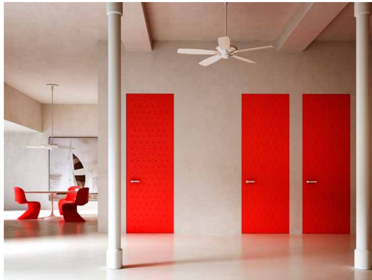
ALBA | SCHWENKTÜR | Lackierte Oberfläche mit Pantograph - Zeichnungen

Hinter unserer Arbeit steckt eine verborgene italienische Geschichte von Erfahrung und exklusivem Design. Das hervorragende technische Know-How bleibt unter der scheinbaren Einfachheit einer wandbündigen Tür verborgen, die durch maximale Anpassung an Kundenwünsche stets den höchsten Ansprüchen an Design und Funktionalität gerecht wird.